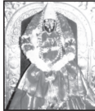
శ్రీ రాజరాజేశ్వరి అమ్మవారు